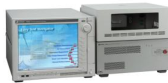
B1505A / 6A パワー・デバイス・アナライザ