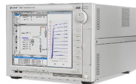
B1500A 半導体デバイス・パラメータ・アナライザ