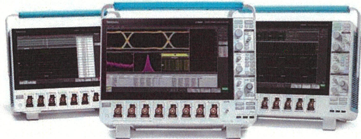
当社該当旧製品/他社同等製品(1GHz以上モデル)