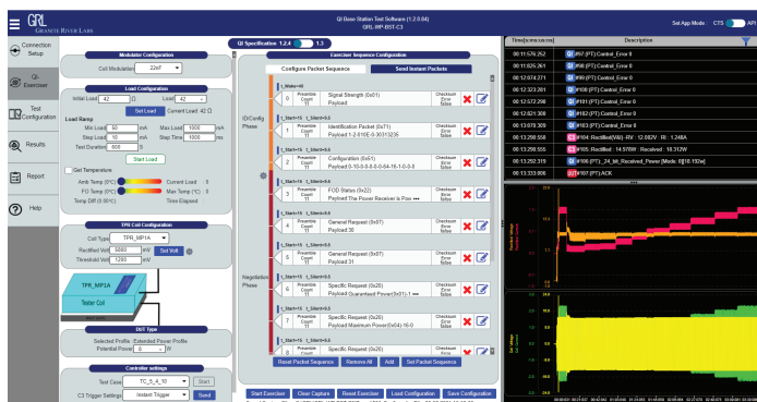
使いやすいインターフェース