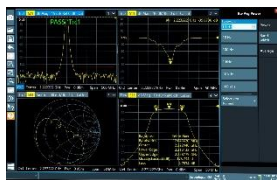
ネットワーク測定画面