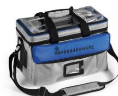
PSEマーク未対応のため外部充電器による充電は不可となります