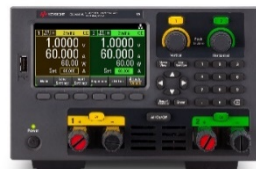
EL34243A 600 W デュアル入力 ベンチトップ型電子負荷 150 V、60 A