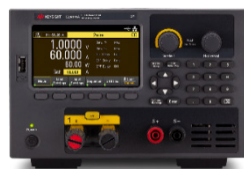
EL34143A 350 W ベンチトップ型電子負荷 150 V、60 A

EL30000シリーズベンチトップDC電子負荷は、プログラマブルで、SCPI完全互換、USBおよびLANインタフェースも標準装備です。また、オプションでGPIBインタフェースも使用できます。アドバンス機能には、スコープビュー、データログ、シーケンス機能などがあり、正確な測定、波形キャプチャ、優れた表示機能で、わかりやすく結果を表示します。