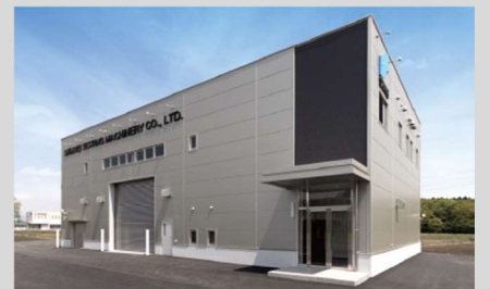
神栄テクノロジー テストラボ（つくば事業所）

豊かな社会へのパートナー 神栄グループ 神栄テクノロジー株式会社 SHINYEI https://www.shinyei-tm.co.jp