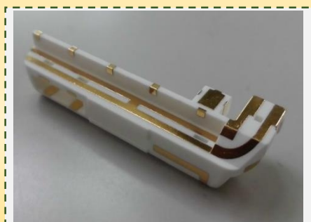
MIDアンテナ (樹脂 + メッキアンテナ)