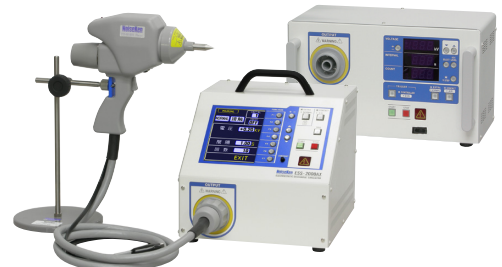
ESS-2000AX / 2002EX

修理対応が終了している静電気試験器および放電ガンをお持ちのお客さまは、後継器(現行機種)への買換えのご検討をお願いします。 後継器(現行機種)については裏ページをご覧ください。