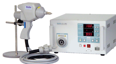
ESS-2001 / 2002